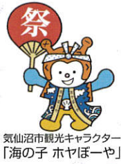
気仙沼市観光キャラクター「海の子 ホヤぼーや」

今年も「目黒のさんま祭気仙沼実行委員会」のご協力により、気仙沼からの新鮮なさんまを炭火で焼いて、熱々の焼きたてを無料で召し上がっていただけます。気仙沼自慢の味を炭火焼きならではの風味で大分県臼杵市特産のカボスを添えてどうぞ！会場内では、気仙沼市立立 たて 立小学校による「鹿踊り」の披露があります。