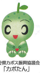
大分県カボス振興協議会「カボたん」